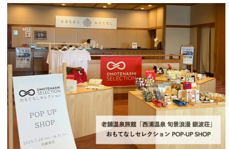
老舗温泉旅館「西浦温泉 旬景浪漫 銀波荘」 おもてなしセレクション POP-UP SHOP