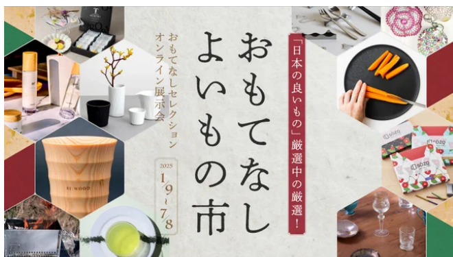
国内バイヤー向けオンライン展示会「おもてなし よいもの市」

https://prtimes.jp/main/html/rd/p/0000000181.000017308.html