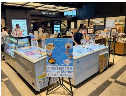
期間限定ポップアップショップ@ 東急プラザ銀座

https://prtimes.jp/main/html/rd/p/000000212.000017308.html