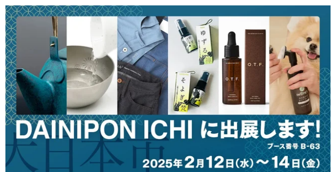
合同展示会「大日本市」への出展