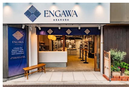
“つながる”体験型ストア「ENGAWA ASAKUSA」