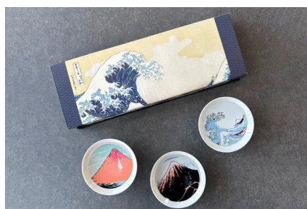
冷感北斎平盃3点セット