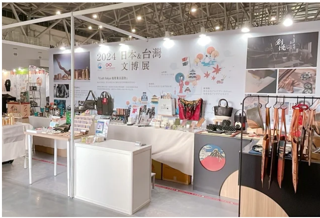
【台湾】2024 CREATIVE EXPO TAIWAN