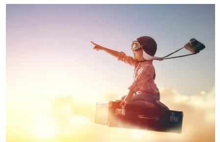
訪日観光客向け託児サービス「Parent Time」