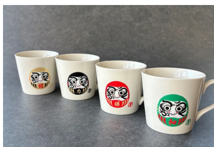
温感合格ダルマシリーズ