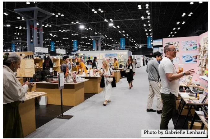
【アメリカ ニューヨーク】NY NOW Summer 2024