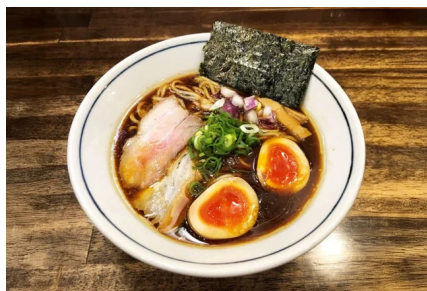
一心煮玉子ブラックラーメン