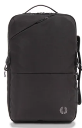
P.I.D・TRABI シリーズ PAK301