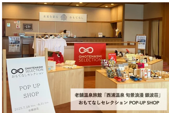
【宿泊施設タイアップ】愛知県の老舗温泉旅館「銀波荘」

日本国内での展開に加え、海外へ向けた展示会へもオンライン・オフライン合わせて積極的に参加しています。“ジャパンプランド”への興味関心の高い台湾をはじめとするアジア圏や、北米・欧州など、現地バイヤーとのマッチングの機会を創出しています。