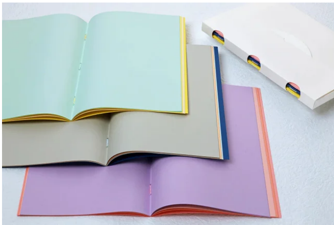
「ペーパーホチキス3色ノート」 有限会社中正紙工 (東京都)