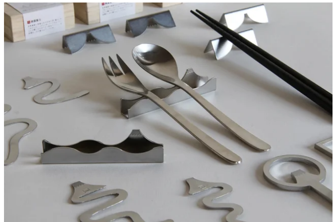
「抗菌富士」 三光製作株式会社 (静岡県)