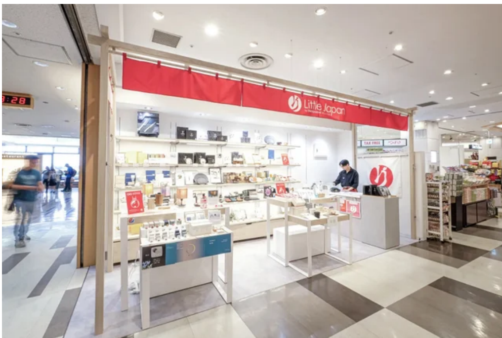
「Little Japan by OMOTENASHI Selection」@成田空港第2ターミナル本館4階

今後も、より多くの外国人旅行者に利用していただくことを目指し、インフルエンサーを活用したSNSプロモーションとキャンペーンの展開を予定しています。