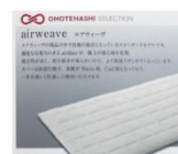
株式会社 エアウィーブ (2017年度金賞受賞)