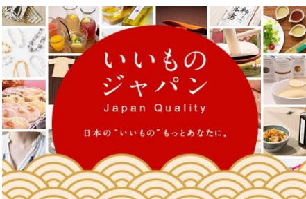
郵便局のネットショップ内 「いいものジャパン」