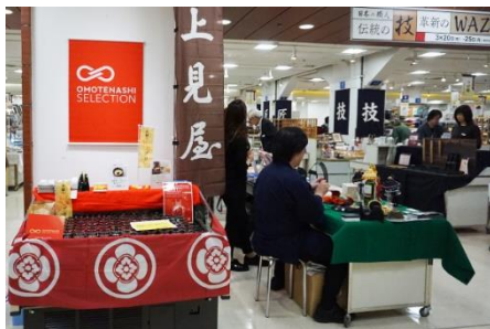
松坂屋上野店「日本の職人 伝統の技・革新のWAZA展」