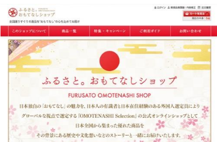
公式オンラインショップ 「ふるさと。おもてなしショップ」