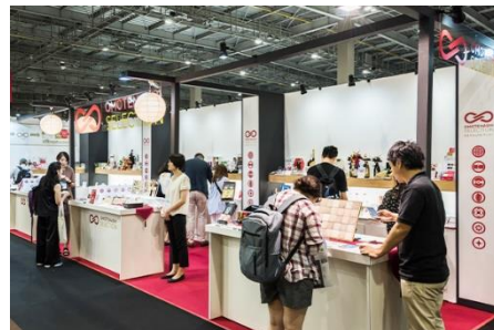
東京インターナショナル・ギフト・ショー