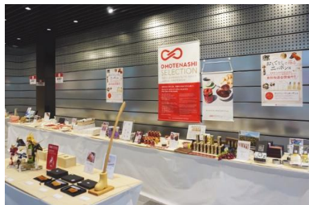
日本橋高島屋S.C. 「おもてなしで巡るニッポン展」