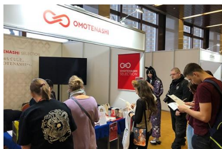
在ロシア日本大使館主催「日本文化フェスティバルJ-FEST AUTUMN 2018」 (ロシア・モスクワ)