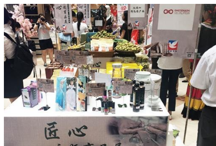
成都イトーヨーカドー双楠店 (中国・四川省)