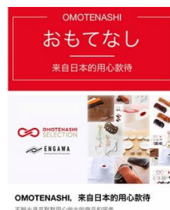
中国向け越境EC 「寺庫(Secoo)」