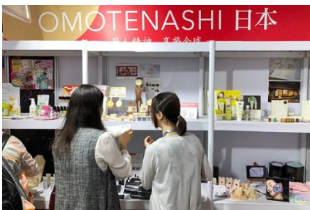
CHINA BEAUTY EXPO 2018 (中国・上海)