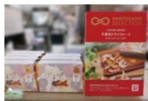
株式会社YARN HOUSE 2020年度 金賞受賞