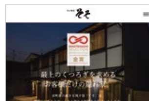
西光堂パートナーズ株式会社 2018年度 金賞受賞 2019年度 金賞・特別賞受賞