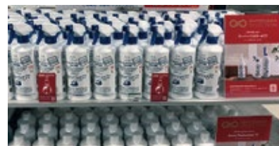
ドーバー酒造株式会社（2019年度受賞）