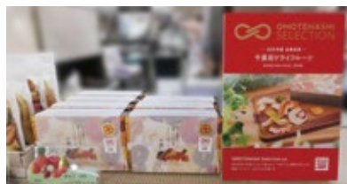
株式会社YARN HOUSE（2020年度金賞受賞）