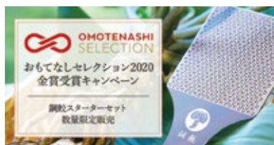
株式会社山本食品（2020年度金賞受賞）