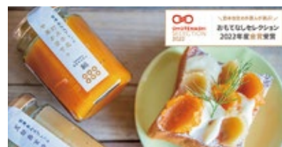
株式会社真田製あん（2022年度金賞受賞）