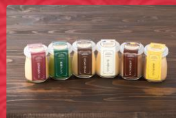
2018年-2022年連続金賞 財宝プレミアムプリン (株式会社財宝)