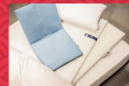
2017年度受賞 エアウィーヴ商品群 (株式会社エアウィーヴ)