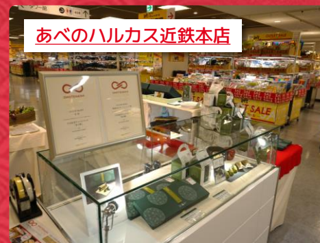
あべのハルカス近鉄本店