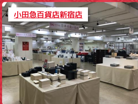
小田急百貨店新宿店