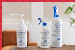
2019年度受賞 ドーバーパストリーゼ77 (ドーバー酒造株式会社)