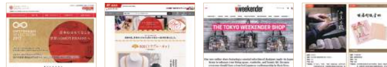
公式オンラインショップ「ふるさと。おもてなしショップ」