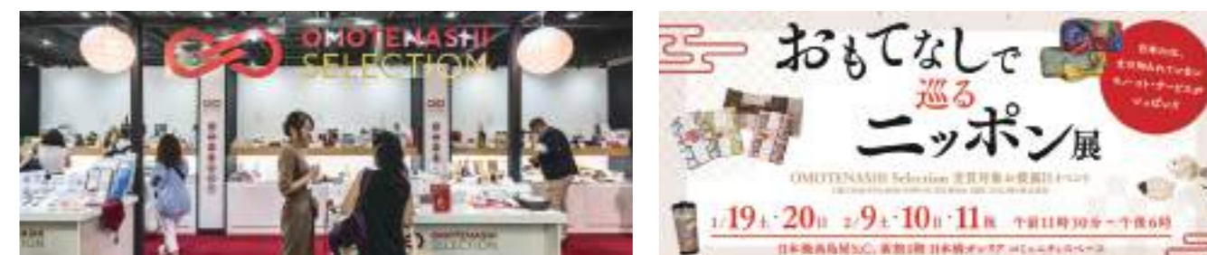
東京インターナショナル・ギフト・ショー 秋2018 LIFE×DESIGN出展